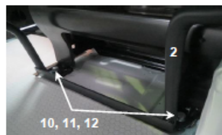
4 Befestigung unten

Die Originalschrauben der Sitzkonsole entfernen, Trenngitter anbringen und mit den Sechskantschrauben M10x45 (10), Federring D10,1 (11) und Kotflügelscheibe 10,5 x 20 x 2mm (12) befestigen. Anzugsmoment 66Nm